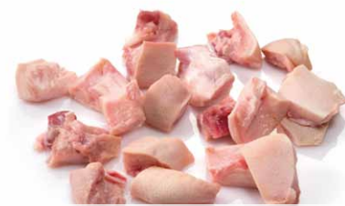
Morro crudo cortado