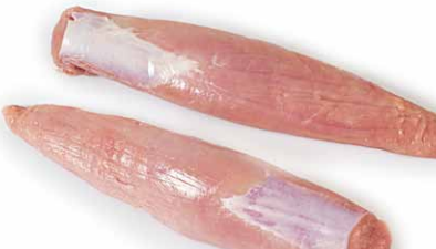
Solomillo sin cordón