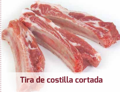
Tira de costilla cortada