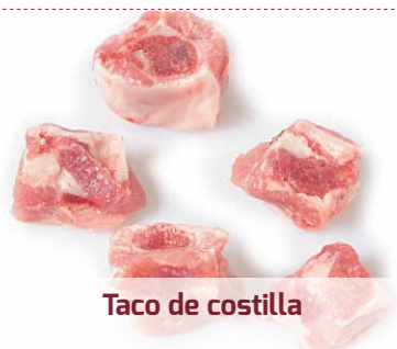
Taco de costilla