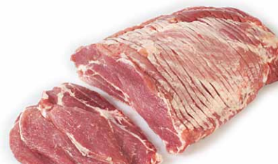
Cabeza de lomo cortada