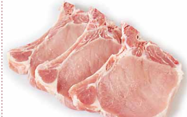
Centro de chuleta cortada