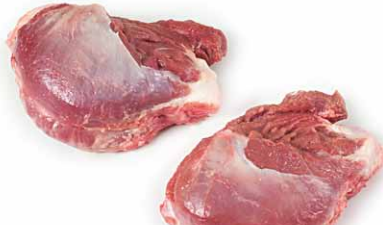
Carrillada con hueso