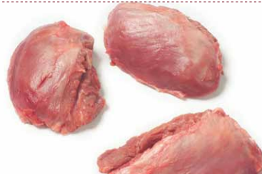
Carrillada sin hueso