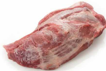
Cabeza de lomo entera