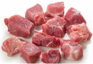
Taco para estofado