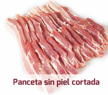
Panceta sin piel cortada