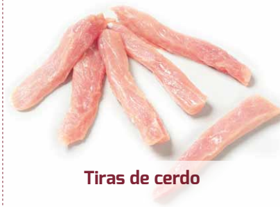
Tiras de cerdo